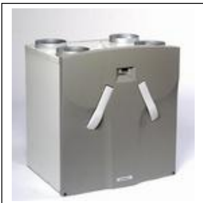
Storckair Comfo D 500