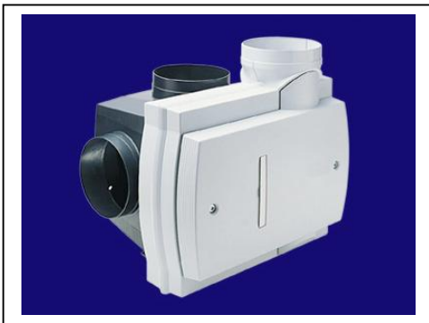
Extractiemotor systeem C