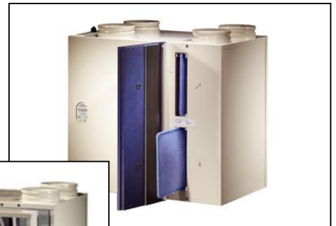
Brink Renavent Medium of Large

Een by-pass klep is aangewezen om in de zomer de woning op temperatuur te houden.