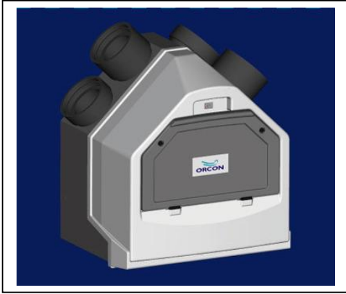
Orcon type HRC 300 4 BP

De goede werking van een mechanisch ventilatiesysteem is mede afhankelijk van de luchttoevoer die door openingen in ramen en gevels moet worden binnengebracht, omdat natuurlijke toevoer door naden en kieren niet meer mogelijk is.